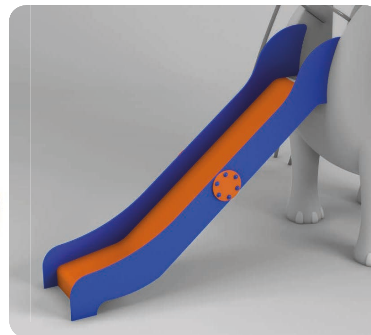
Ejemplo de instalación